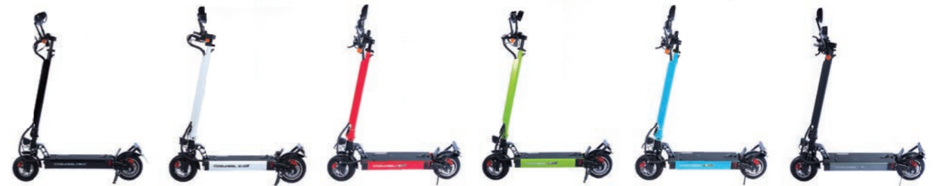
・アーバンブラック ・シルクホワイト ・カーマインレッド ・カントリーグリーン ・マリンプール ・モダングレー

簡易脱着式の大容量 10Ah バッテリーを標準装備。オプション品の 20Ah バッテリーを装着すれば最大約 70km の長距離走行が可能です。